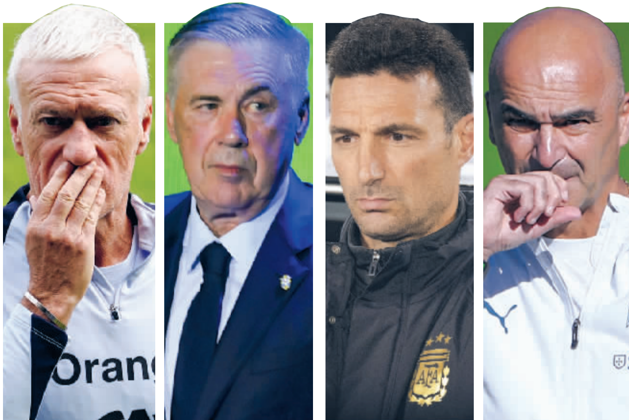
从左至右依次为法国队主帅德尚、巴西队主帅安切洛蒂、阿根廷队主帅斯卡洛尼和葡萄牙队主帅马丁内斯。