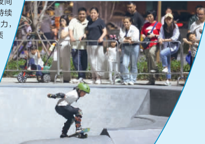
■5月23日,一名小朋友在河北省石家庄市织音1953文化艺术园区滑板。