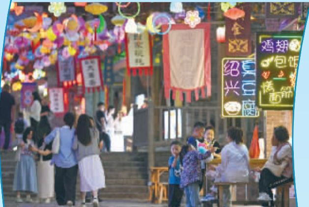
■5月23日,游客在河北省石家庄市鹿泉区龙泉古镇游玩。