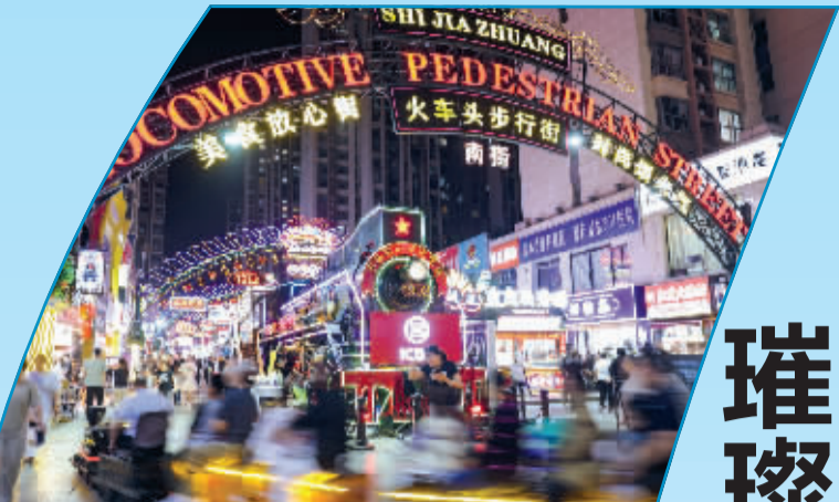
■5月23日,人们在河北省石家庄市裕华区火车头步行街游玩。

近年来,河北省石家庄市依托城市更新建设契机,持续发展夜经济,整合商贸、文旅、体育等优质资源,不断丰富夜间消费场景、升级消费品质,围绕“夜耀石家庄”主题推出特色活动,完善“食、购、游、娱、文、体”全链条夜间消费体验,持续释放消费潜力,为城市高质量发展注入动能。