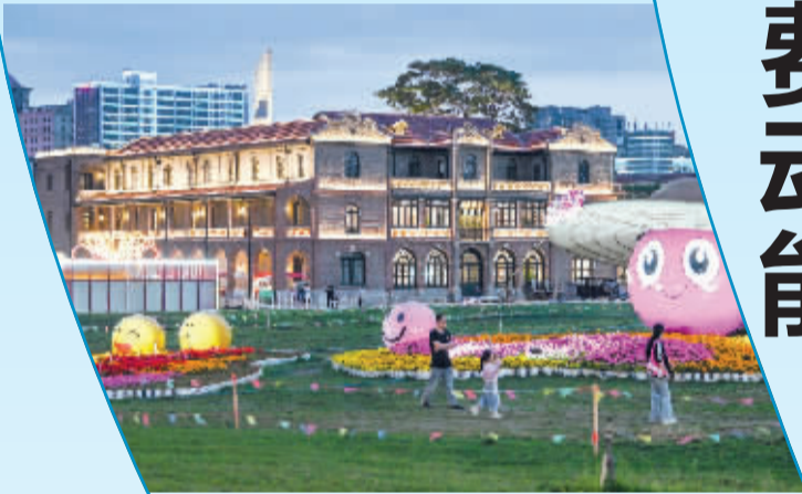
■5月22日,游客在河北省石家庄市新华区正大广场休闲游玩。