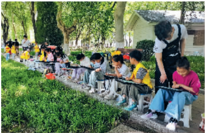
■用画笔记录美好时光。