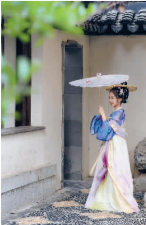
■这一刻,模糊了光阴。