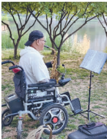
■轮椅上的乐章。苏中华 摄