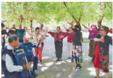
■同唱一首歌。