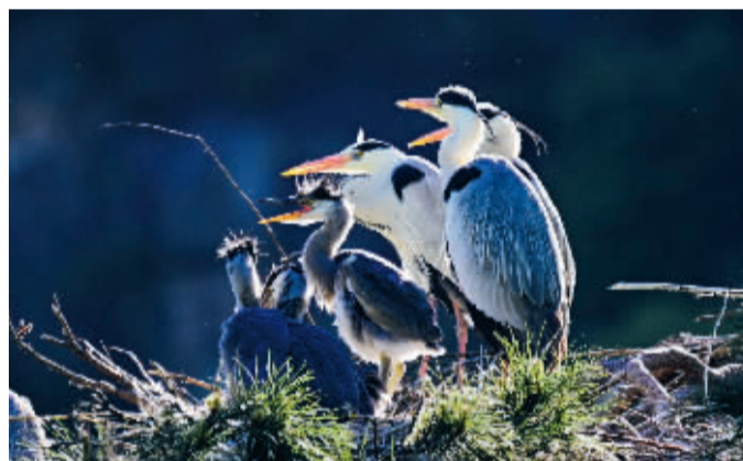
■忙碌的精灵。

这座城市里的每一缕风、每一声笑,还有每一声鸟鸣,都是初夏写给生活的温柔注脚。诗意,蕴藏在最动人的烟火里,就此定格成一幅幅美好的回忆!