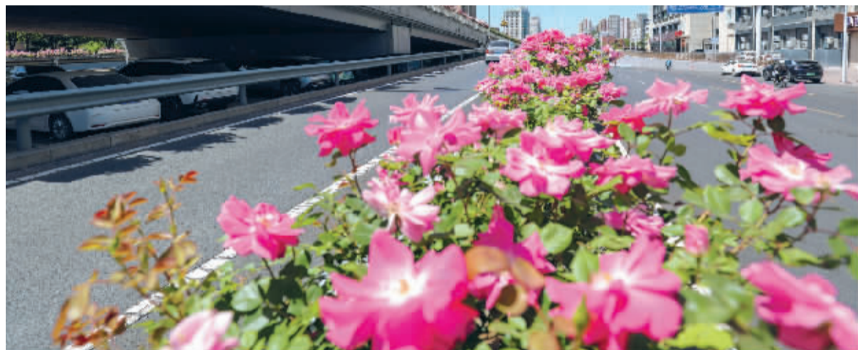
■槐安路上的月季。