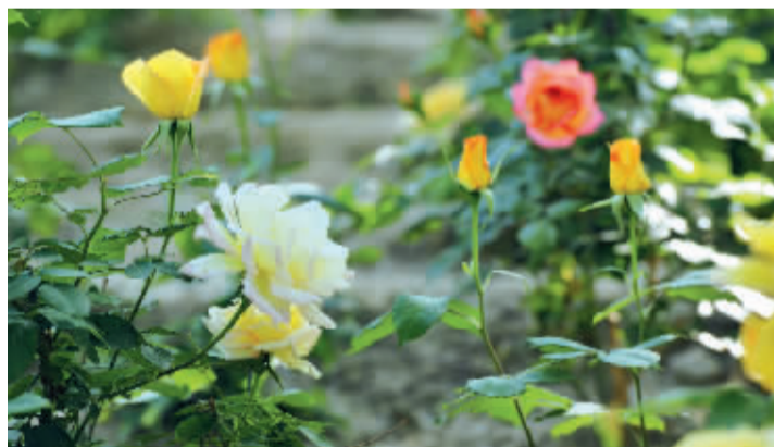
■东环公园的月季花丛。

5月的石家庄,正是市花月季的主场,不同品种的月季竞相迎风吐艳、傲然盛放,为这座城市铺展出一幅浪漫而热烈的多彩画卷。