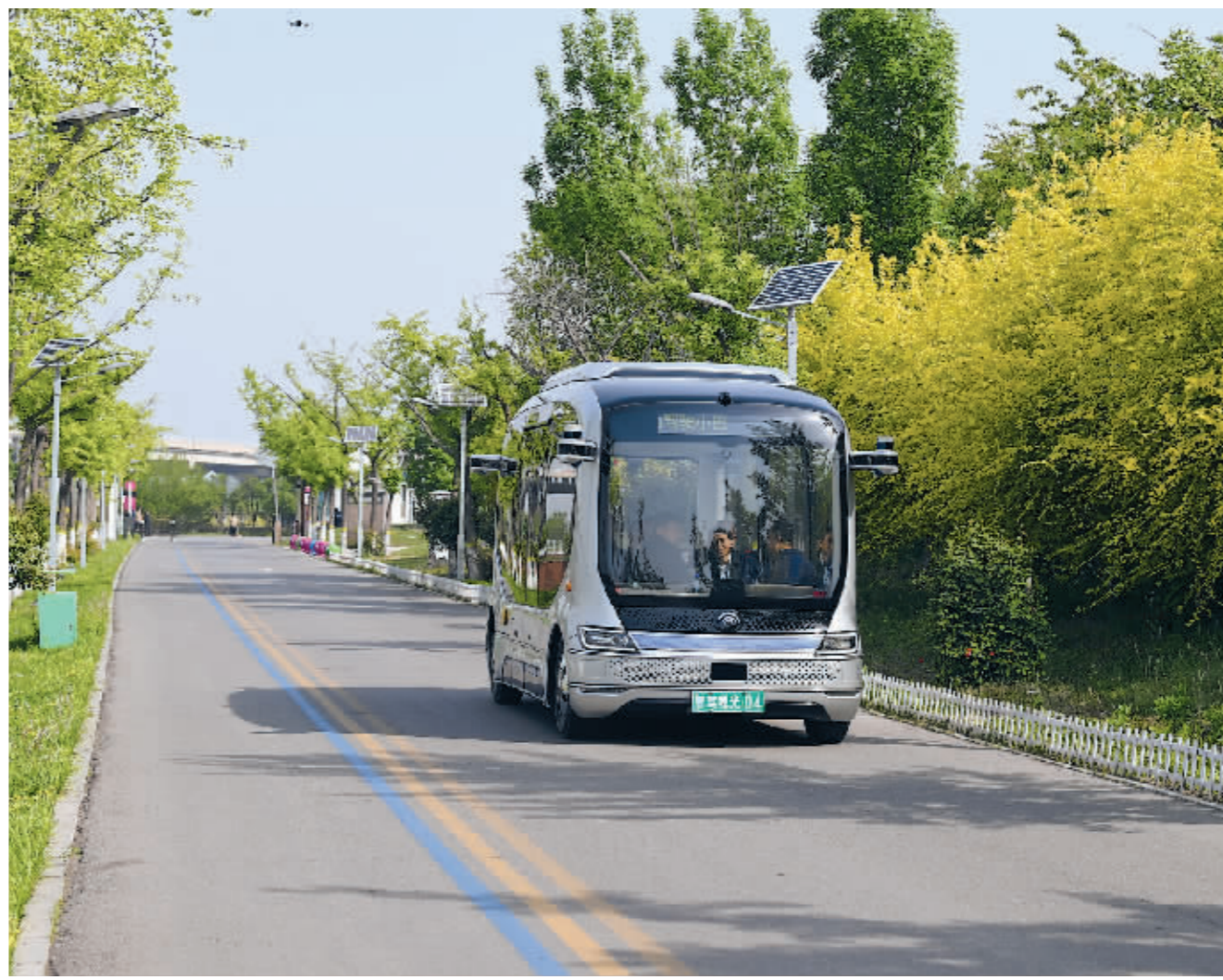
■4 月 22 日，石家庄公交首条 L4 级自动驾驶观光线路在滹沱河艺术生态岛正式开通。石家庄日报记者 郝磊 摄

石家庄地铁建设已进入高速推进期，一台台盾构机在地下奋力掘进，建设者们奋力拼搏，不断迎来盾构始发与区间贯通及车站主体结构封顶的节点。其中，最令人振奋的是 4 月 15 日晚，随着最后一面 35kV 开关柜断路器合闸，地铁 1 号线二期北段工程供电系统 35kV 环网一次送电成功，标志着该线路完成全面受电，正式“电通”。据介绍，此次送电范围涵盖地铁 1 号线二期北段工程 2 座车站、3 个区间。35kV“电通”是地铁建设中继“洞通”“轨通”后的又一重