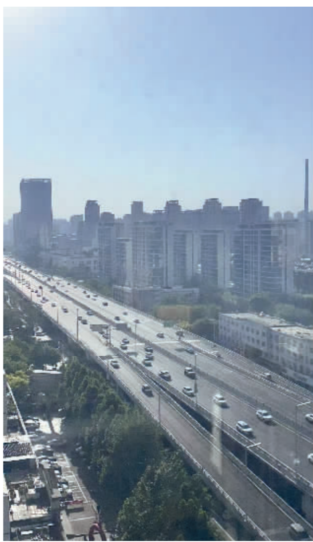
■和平路高架桥上车流如织。

4 月 22 日，石家庄公交首条 L4 级自动驾驶观光线路在滹沱河艺术生态岛正式开通，该线路以宇通 L4 级自动驾驶巴士“小宇”为运营载体，为市民游客提供便捷、安全的出行体验，为