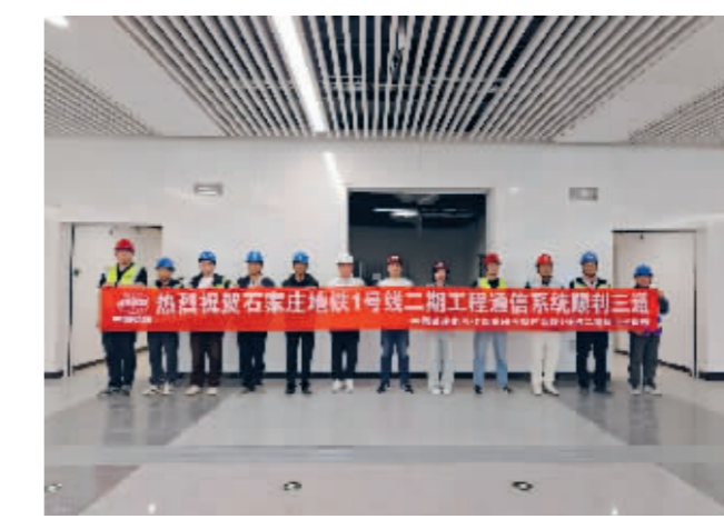
■石家庄地铁 1 号线二期北段工程实现通信“三通”。

顶。该项目规划建设 3 栋塔楼及配套附属裙房，业态涵盖办公、商务、酒店等。其中，西塔楼已于 2025 年 12 月完成核心筒封顶，南塔楼主体结构施工至 17 层。本次封顶的北塔楼地上 17 层，建筑高度 78.6 米，地上建筑面积 3.97 万平方米。项目建成后，将打造集金融服务、商务运营、高端办公于一体的复合型城市商务地标，进一步完善高铁片区功能业态。