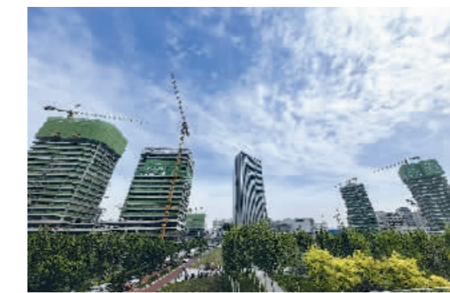
■高铁片区建设如火如荼。

“32 号地块‘城市客厅’项目目前已完工，我们正加紧推进石家庄高铁站皇冠假日酒店的内部装修。”石家庄城投集团所属城投集团相关负责人介绍，项目管理团队坚持精细化施工，严把材料质量和工艺标准，确保“城市客厅”项目以高品质形象呈现在市民面前。不远处的 14 号地块项目北塔楼主体结构实现了顺利封