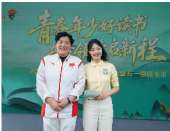
■奥运冠军巩立姣现身会场为本次活动助力。