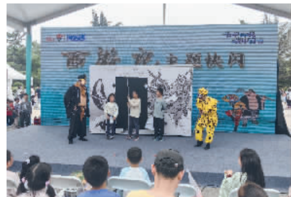
■《西游记》主题快闪活动。

当天儿童音乐教育剧《七耳兔》也同期上演,以奇幻冒险故事为载体,带领观众逐一认识大号、木琴、萨克斯、吉他、手风琴等多种乐器。4月28日晚,独角戏《一只猴的报告》将上演,该剧改编自卡夫卡经典小说《致某科学院的报告》。5月1日至2日,科普音乐剧《万能科学接班人》将连续演出4场,剧中巧妙融合茶水变色、大象牙膏、弹力泡泡等11个科学实验,让知识在舞台上“活”起来。