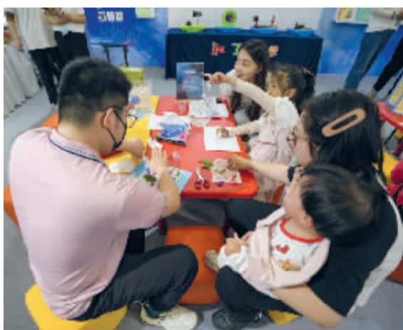
■场内的亲子体验活动。