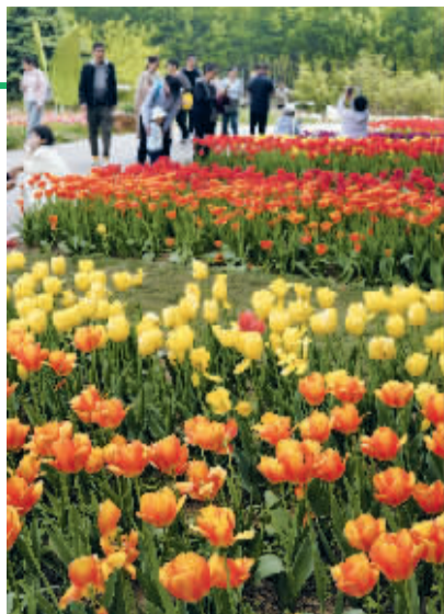
■徜徉在花海。