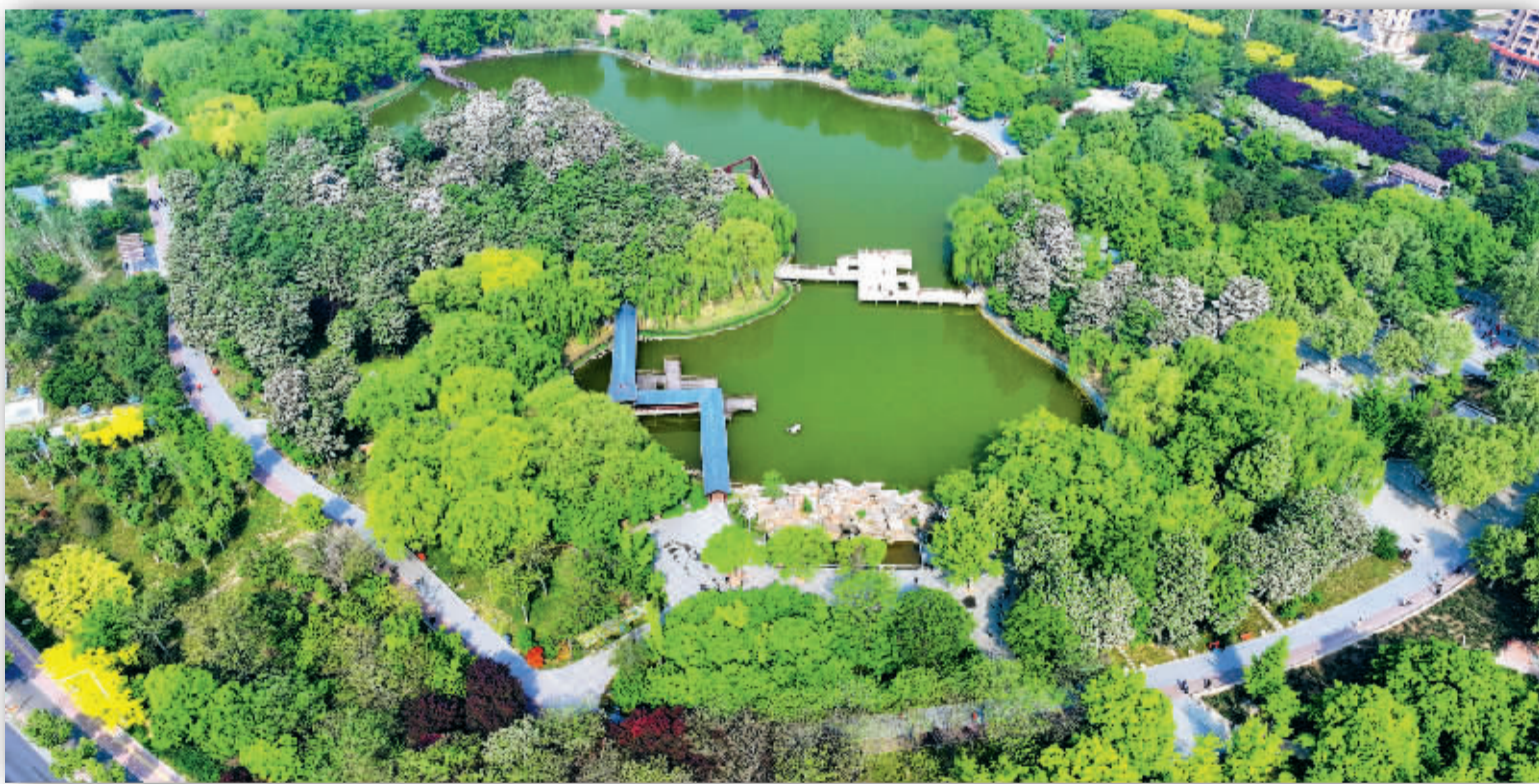
■鸟瞰东环公园。

谷雨落尽，不是春的告别，而是万物生长的序章！春风带着草木的清香，也带着新生的力量，把这一季的温柔，都留在了时光里。