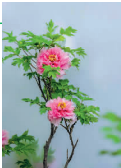
■国色天香美如画。