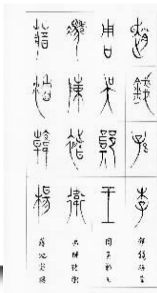
■郝建文书法作品《百家姓》局部。