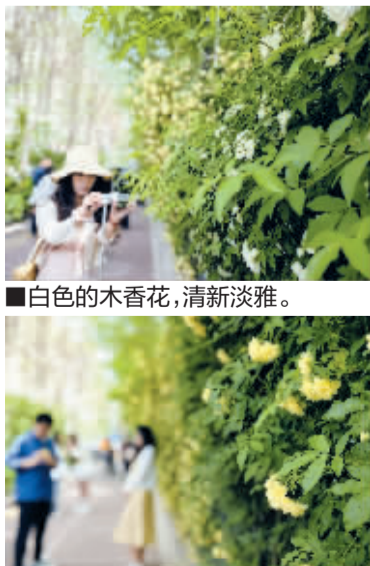
■团团簇簇的木香花,美不胜收。