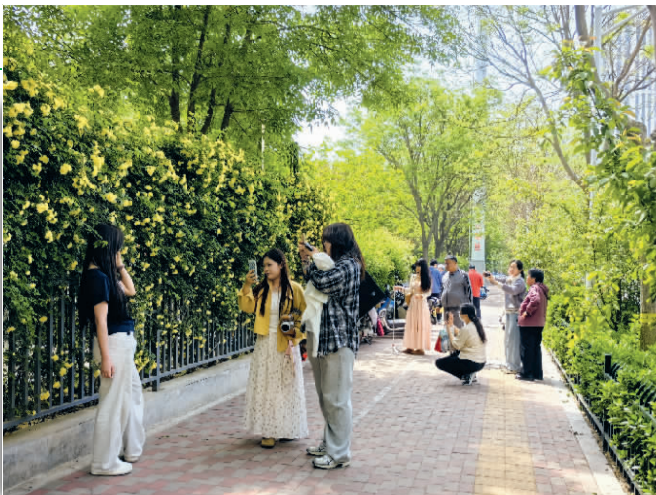
■体育公园,木香花开得绚烂,市民们为它而留影。

4月,石家庄市体育公园的木香花迎来盛花期,密密匝匝的蜜黄色小花沿墙如瀑倾泻而下,香气袭人,吸引了大批市民前来拍照打卡,成为社交媒体上热议的“网红花墙”。