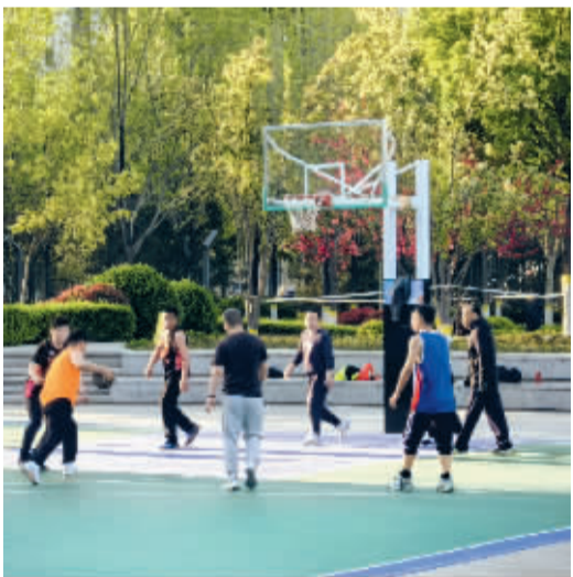
■拾光智慧体育公园内,篮球爱好者正在进行一场激烈的比赛。