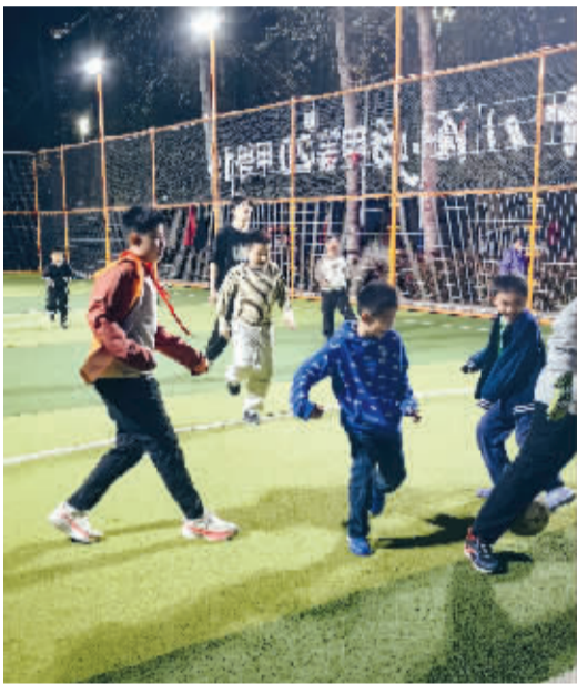
■晚上,希望绿洲公园里孩子们在足球场上踢球。