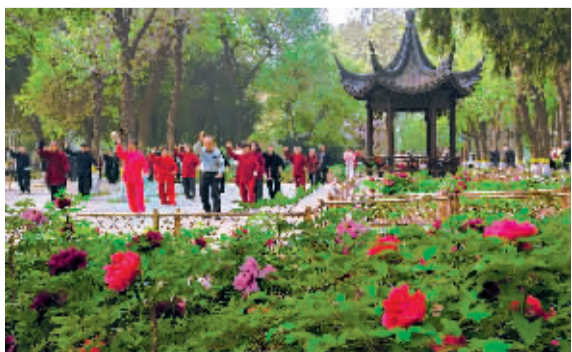
■长安公园的牡丹盛开，太极爱好者在这里打起了太极。