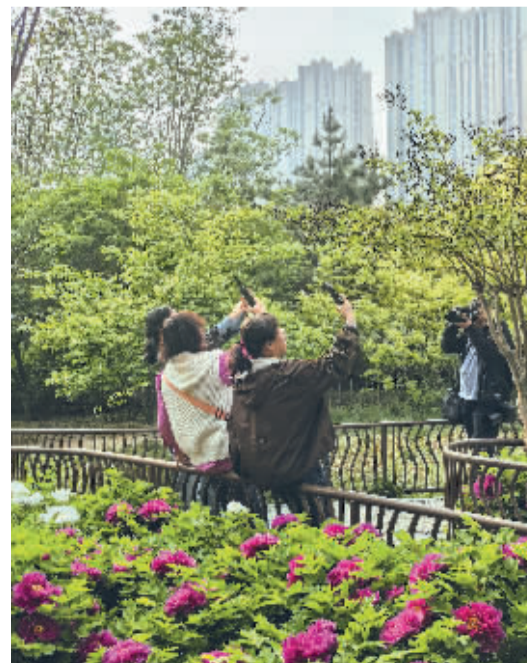
■东环公园的牡丹园内，游客在拍照打卡。