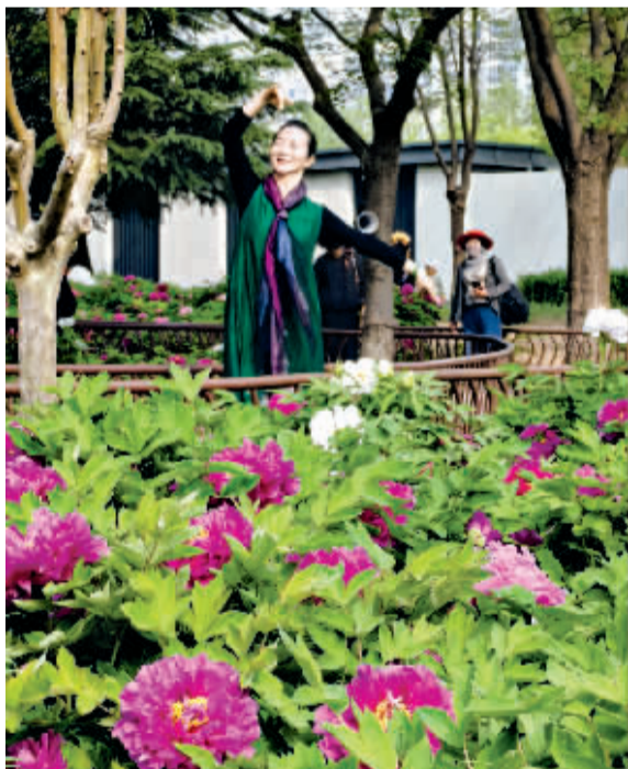
■东环公园的牡丹园内，一位游客沉浸其中跳起舞来。