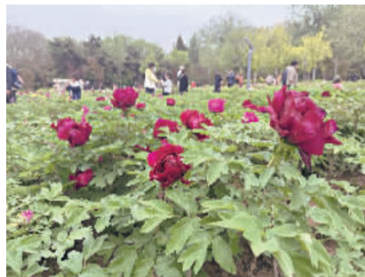
■裕西公园的黑牡丹初绽。

温馨提示：各位游客，在欣赏花开盛宴的同时请勿攀折花枝，爱惜花，让美景与文明同行，共同守护这份属于广大市民的美好景色。