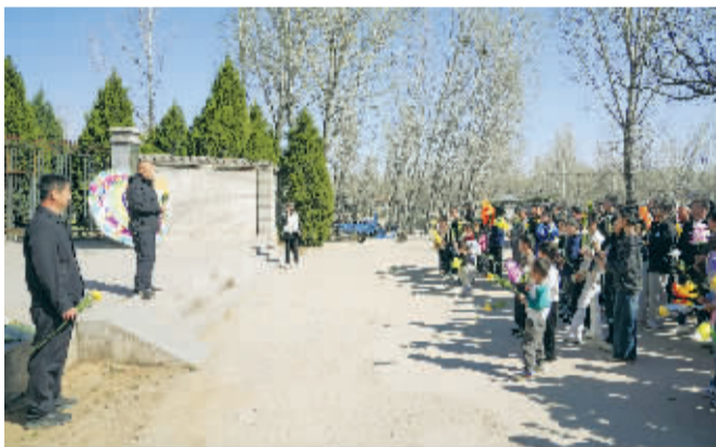
■村里的负责人讲述祭奠烈士的意义。