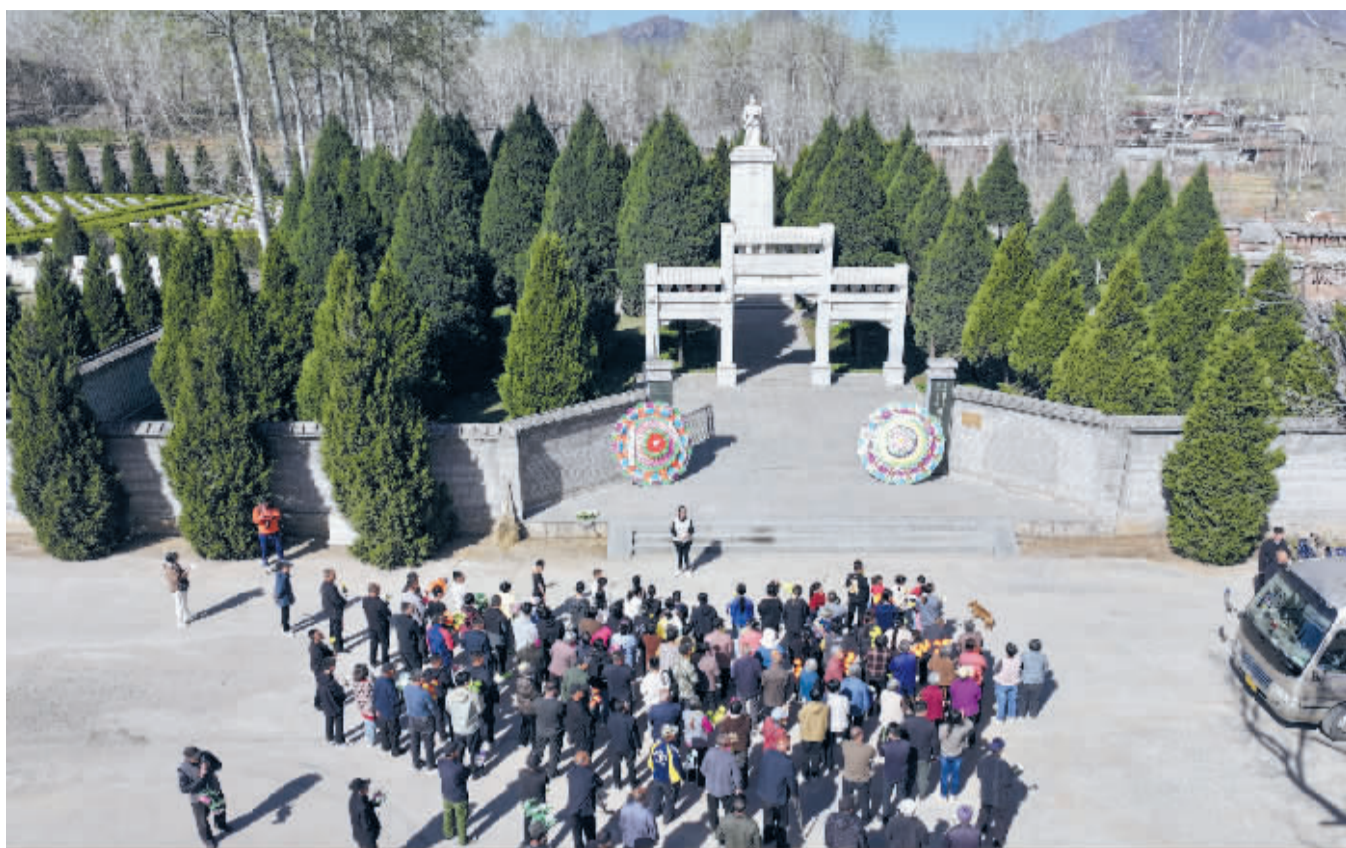
■村民在烈士陵园前集合。