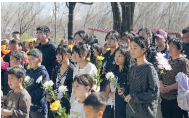
■村里的孩子们手拿献花。