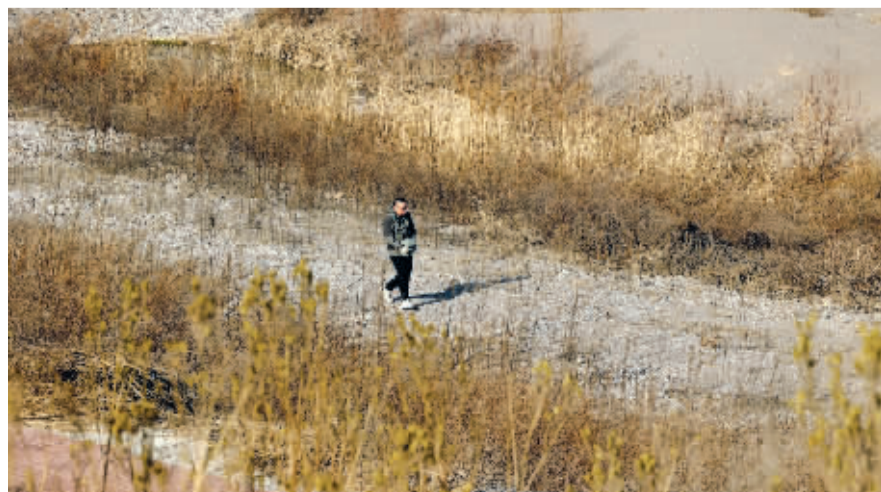
■在滹沱河拣鹅卵石。