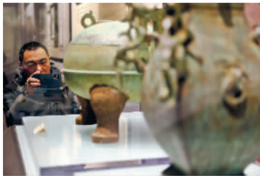
■研究铜鼎上的中山篆。