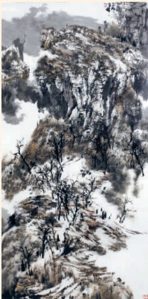
■云淡天高(国画) 白云乡