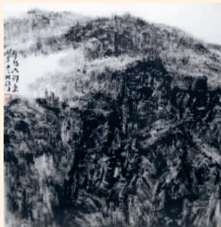
■邢各庄写生(国画) 曹凤祥