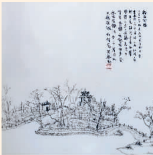
■裕西公园(国画) 孔朋举