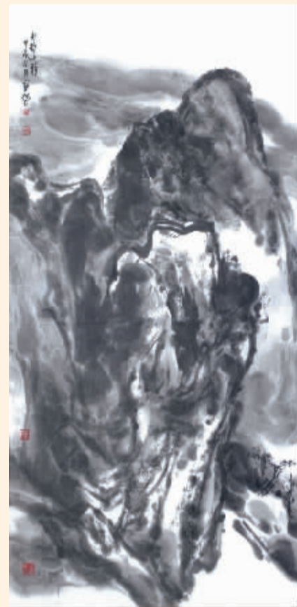
■太行山韵(国画) 戴魁