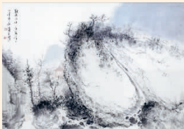
■观景临溪(国画) 崔强