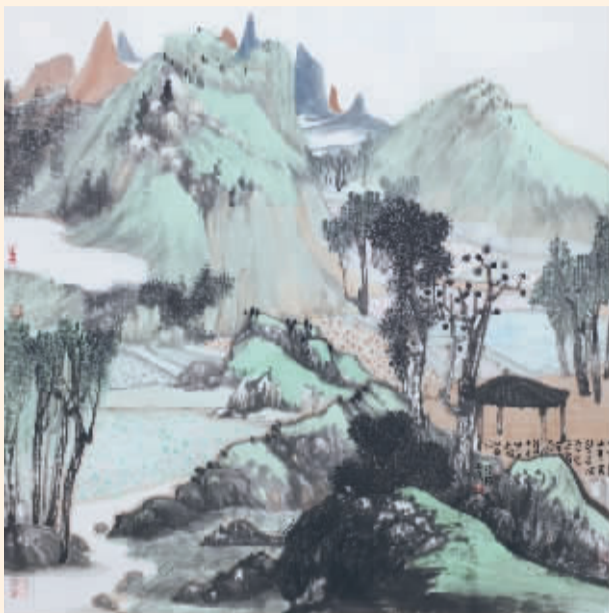
■十里看山(国画) 刘子樵