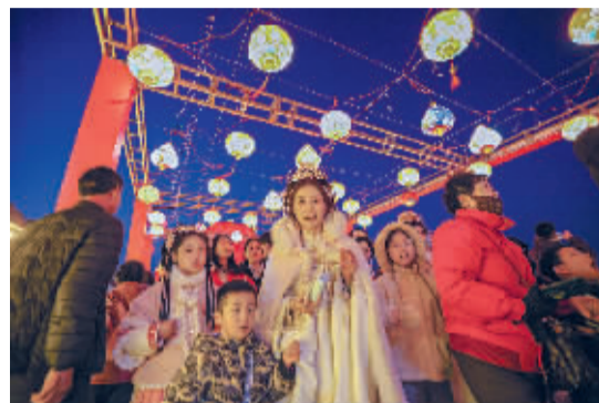
■游客们开心逛灯会。