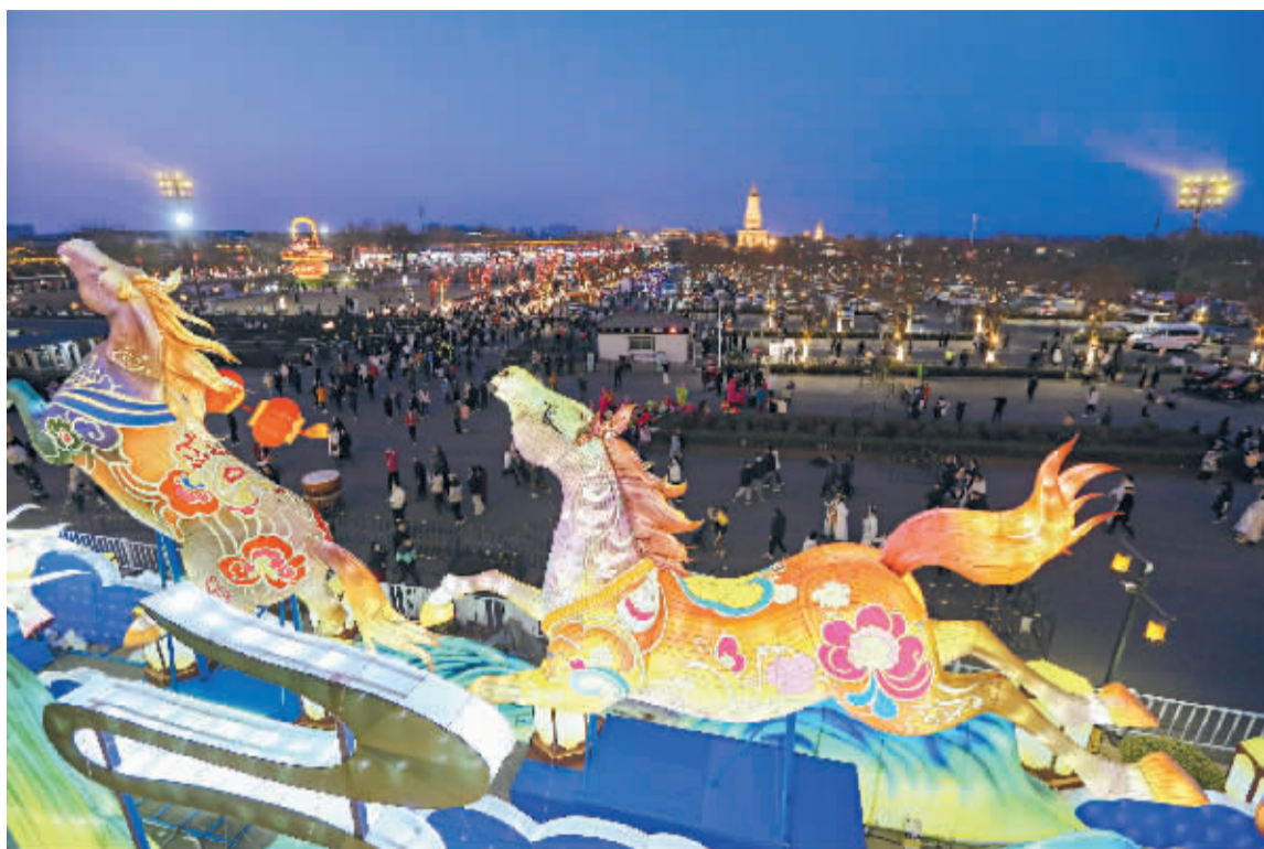
■彩灯掩映下的正定古城。