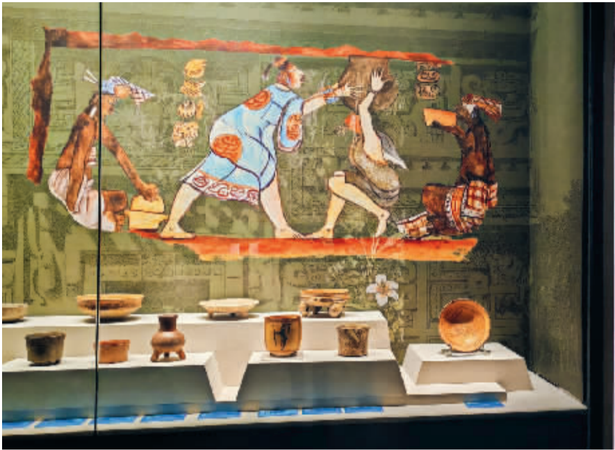
■新春特展之一“丛林圣殿——墨西哥玛雅文明展”。