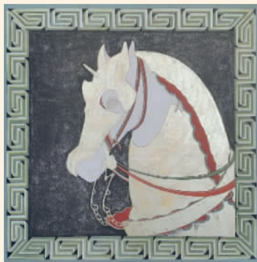
■黄金甲(纸本、金箔、重彩) 赵栗晖