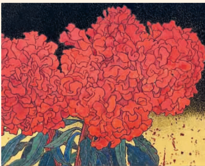
■灼(纸本、金箔、重彩) 刘智勇