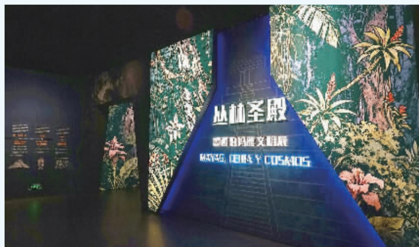
■河北博物院的玛雅文明展。

在近几年的旅游热潮中，“刷馆”已经成为很多年轻人的旅游方式。每到一个新城市，必然要逛逛当地的博物馆、展览馆、图书馆等地，在这些底蕴深厚的室内天地，沉浸于历史与文化的长河。如今正值寒冬，不如来石家庄刷刷这些馆，总有一些惊喜等着你。