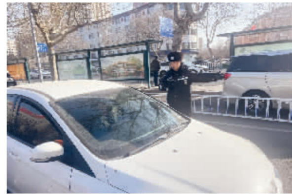
■石家庄交警二军正在劝离违停车辆。