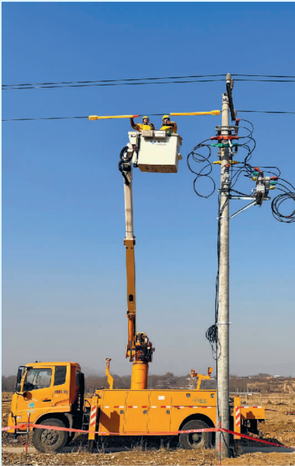
■田野上,带电作业班工作人员在寒风中进行着高空作业。