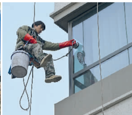
■保洁工人在高空实施作业。