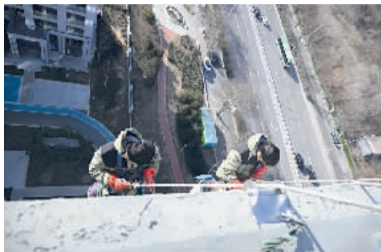
■保洁工人从楼顶开始实施作业。