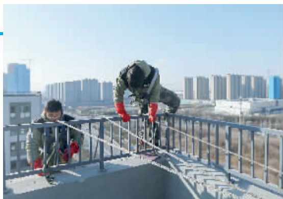
■保洁工人翻越楼顶护栏，开始实施作业。