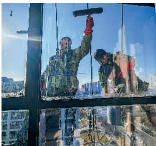
■保洁工人在15楼窗外实施作业。