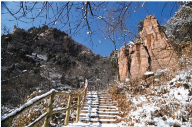
■冬季来王母山享受宁静之旅。

当北风呼啸而来,石家庄平山的冬天则是一幅用冰雪的晶莹、热泉的氤氲、灯光的绚烂与药膳的醇香共同绘就的斑斓画卷。滑雪板上飞扬的激情、温泉池里熨帖的暖流、冰瀑折射的奇幻光影、山间弥漫的养生哲学……每一种体验都切中了不同游客对冬日旅行的不同想象。让我们走进石家庄平山,解码平山冬天的独特魅力,让身心在寒冷与温暖的碰撞中,收藏一场关于旅行的美好记忆。