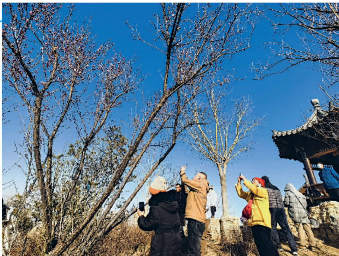
■山顶这株红梅与古典的亭子及游客形成一幅美丽的赏梅图。