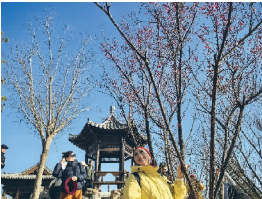
■市民在山顶这株红梅前拍照留念。