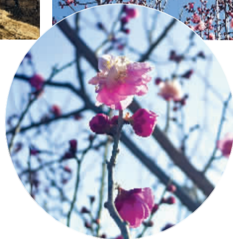
◀一朵凌寒开放的红梅。

一般红梅冬春开花,称报春花使,独放于百花之前,在石家庄一般在1月下旬至3月上旬开放。此时,梅岭春早公园的这几株红梅开放,既得益于其背风向阳的独特地势,也离不开近日天气的助力。而这座公园因其独特的地形与气候条件,尤其适合梅花的生长。到了早春时节,漫山开遍梅花,成为石家庄早春时节最美的景致之一。除了赏梅,梅岭春早公园还围绕“梅”文化精心打造了多重游览体验。“望梅”“寻梅”“闻香”“探梅”等主题景点的设置,让游客在移步换景间,沉浸式感受梅之形、色、香、韵,完成一场充满诗意的旅程。