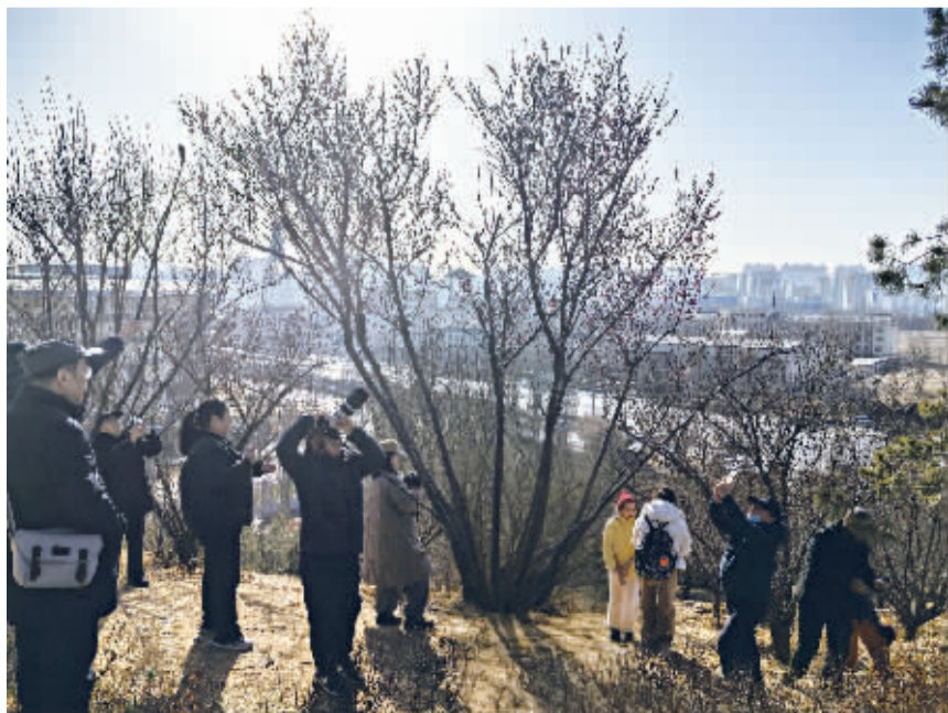
■山顶这株开得最好的红梅前,围满了拍花的人。