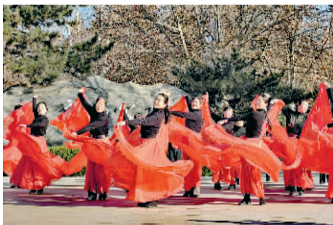
■舞出一道风景。