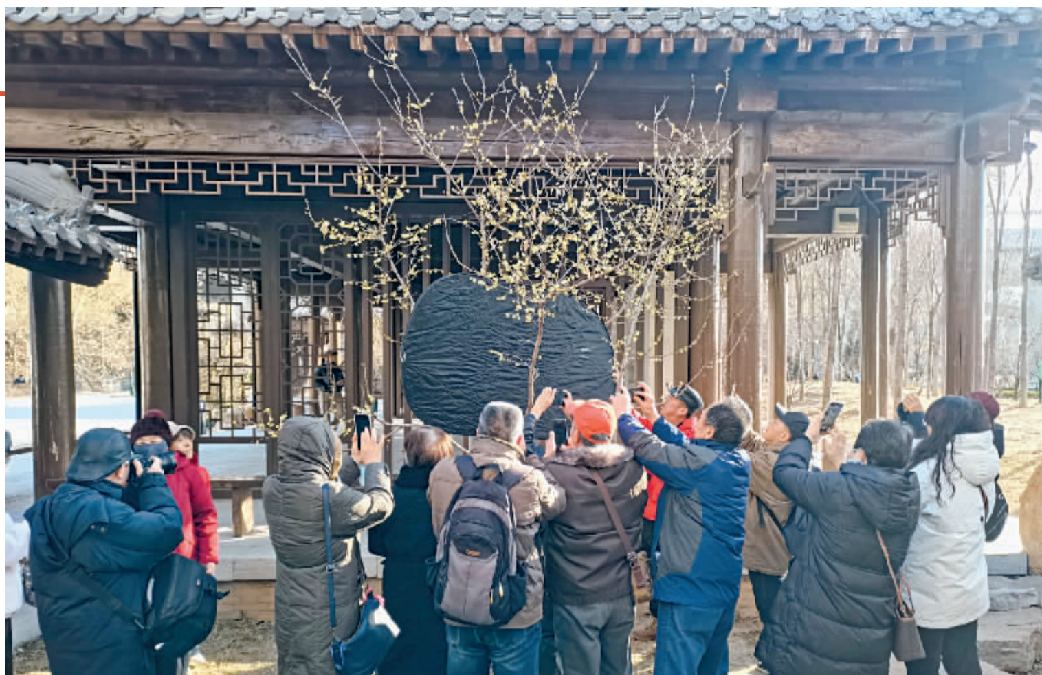
■塔南公园蜡梅香。