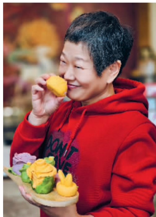
■多彩的生活。