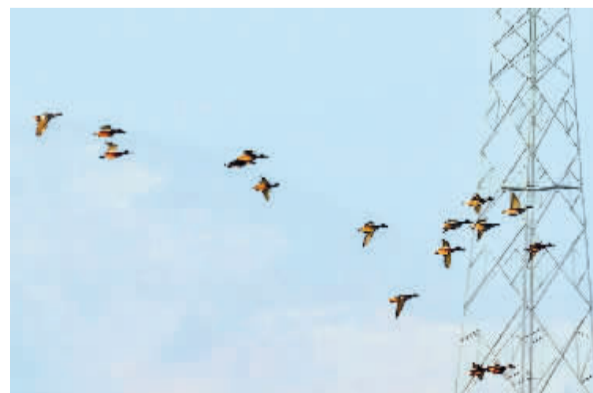
■掠过天空的候鸟。