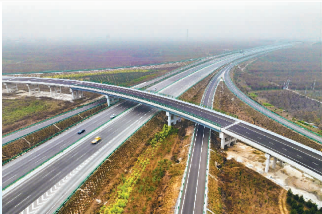
■衡昔高速石家庄段通车现场。

未来,石家庄都市圈将成为京津冀世界一流城市群的战略支撑、拉动冀中南经济增长的强大引擎、推动京津冀协同发展和中部崛起战略融合的重要枢纽。