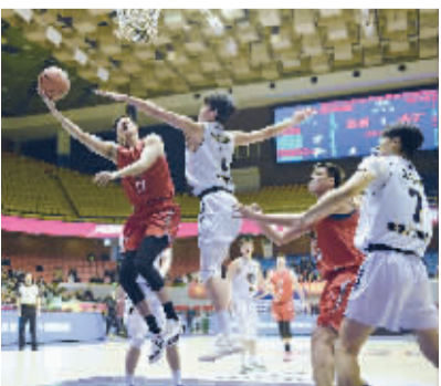
■石家庄翔蓝队员在全国男篮联赛中比赛中。