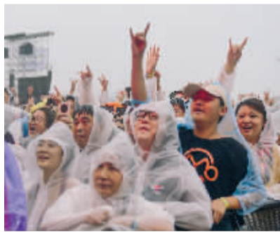
■石家庄草莓音乐节,乐迷们在雨中与歌手互动。