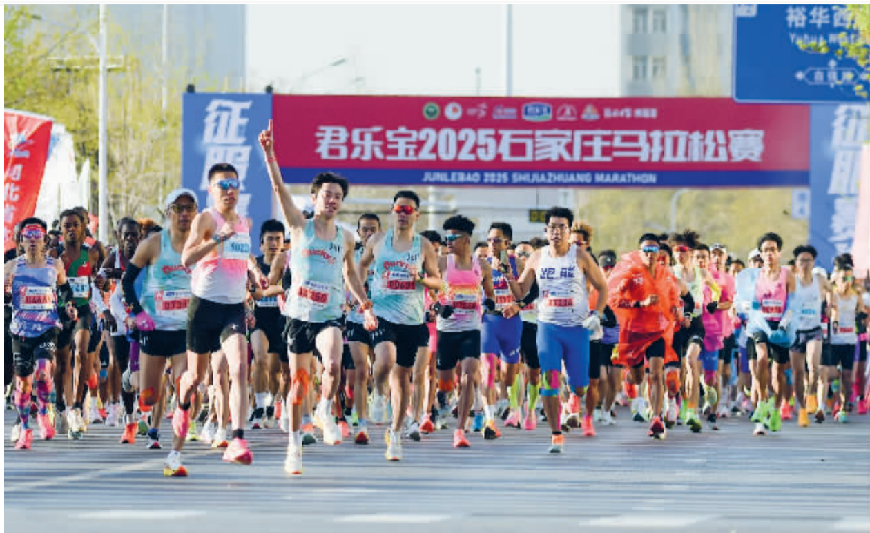
■石家庄马拉松赛现场。

提升公共文化服务水平、打造特色文化品牌、推动文艺精品创作、丰富群众文化生活;着力推动体育设施向“优质均衡”升级、赛事供给向“品牌多元”提质……让文化与体育更加惠民。