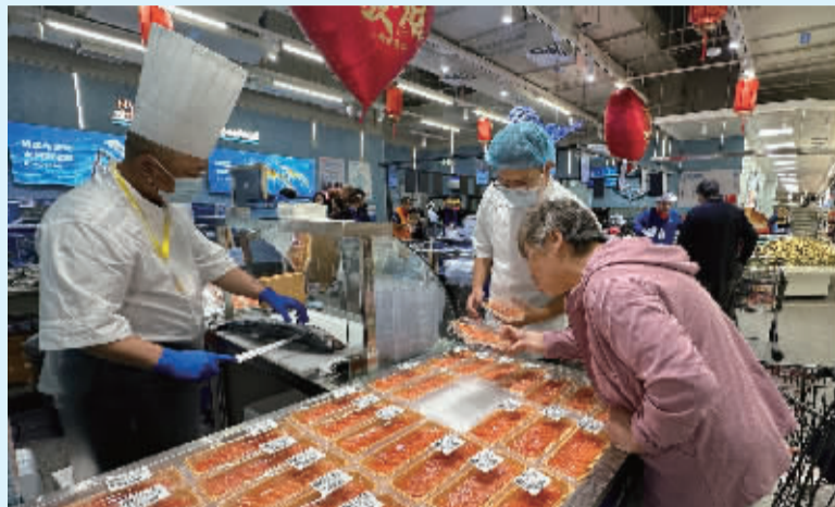
■勒泰商业中心的“盒马鲜生”吸引了众多消费者。

2025 年,石家庄市创新多元化消费新场景,扩大服务消费,发展数字消费,大力推进提振消费专项行动,持续打造区域性消费中心城市。石家庄市新商业层出不穷,新业态多元化发展,特色活动层出不穷,凸显了城市经济的新活力。