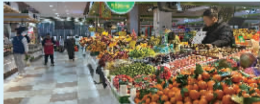
■北宋路上的便民市场菜品水果一应俱全。