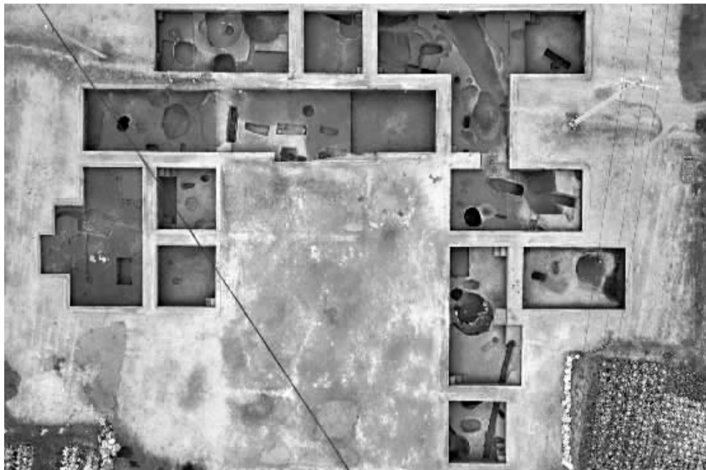
■临城南盘石遗址发掘区。