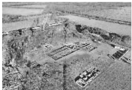
■张北元中都遗址 2025 年发掘现场。