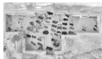
■涑水富位遗址 2025 年发掘区。