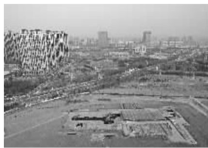
■石家庄东垣古城遗址 2025 考古现场。