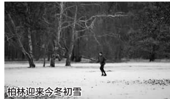
柏林迎来今冬初雪

去年9月,应韩国政府要求,“电报”平台承诺严打色情内容,并与有关部门合作,从平台上删除相关色情内容及其他非法内容。