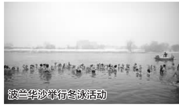
波兰华沙举行冬泳活动