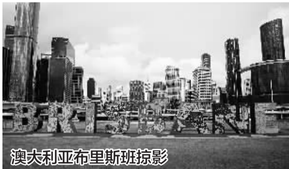
澳大利亚布里斯班掠影

■这是11月21日在澳大利亚布里斯班拍摄的标识及中央商务区楼群。布里斯班位于澳大利亚东部,是昆士兰州的首府。