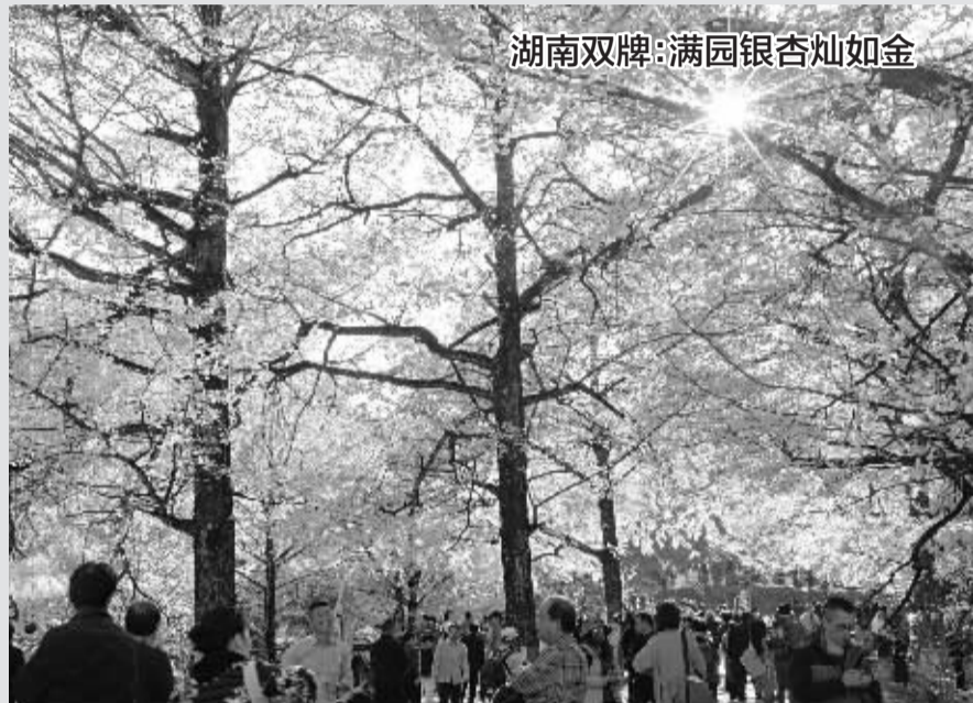
湖南双牌:满园银杏灿如金