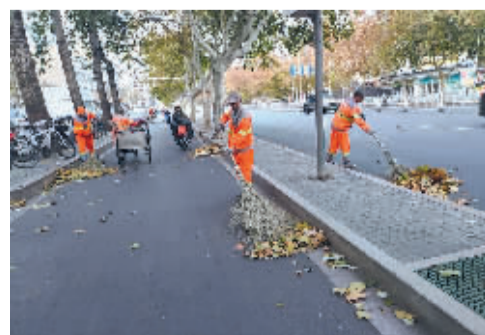
■16时许,清扫四班的环卫工人仍在街头开展巡回保洁。