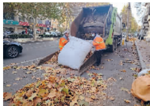
■将落叶倒入压缩车。