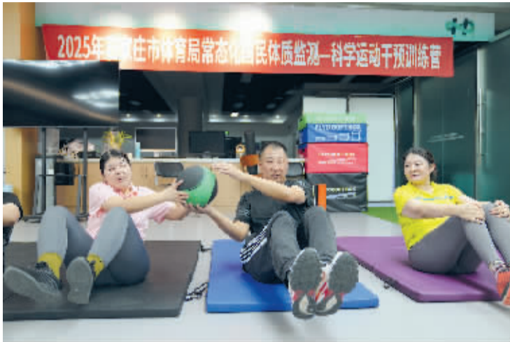
■大家在进行传球游戏。