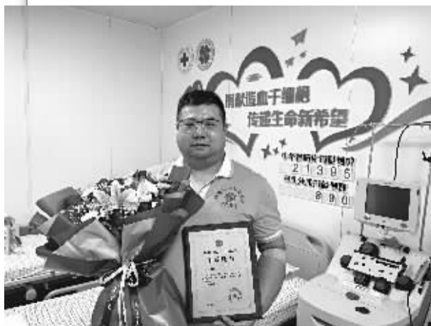
■河北省第890例造血干细胞捐献者孙先生。