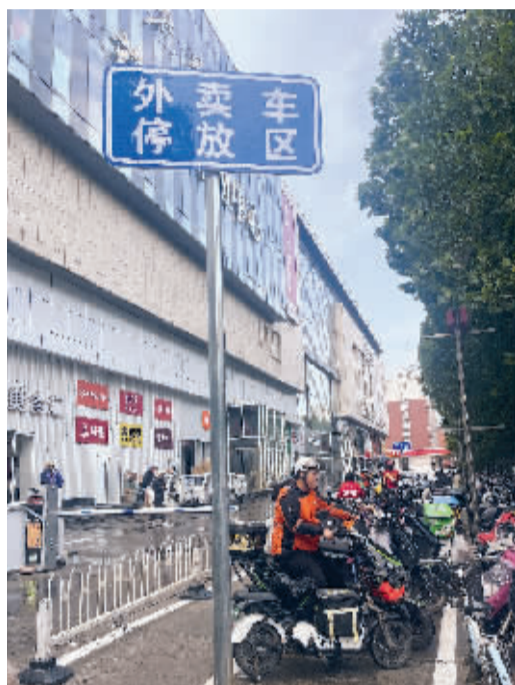
■专门设置的外卖车停放区,方便外卖小哥停车。

事件:针对该商圈非机动车停车难、停车乱以及违停的现象,近期,警企联动多措并举,让周边交通环境得到明显改善。