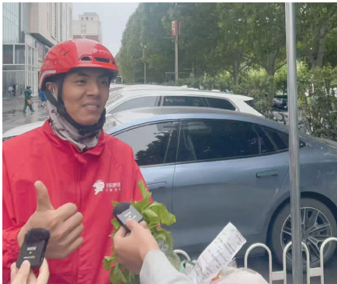
■外卖小哥为专门设置的外卖车停放区点赞。