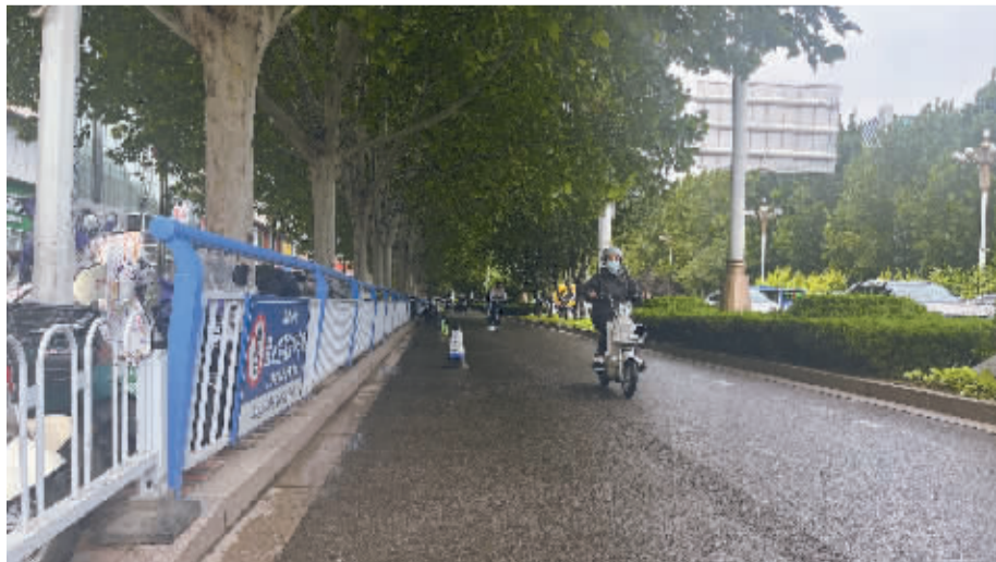
■现在,益友商圈附近的非机动车道上没有了违停电动自行车,交通顺畅多了。