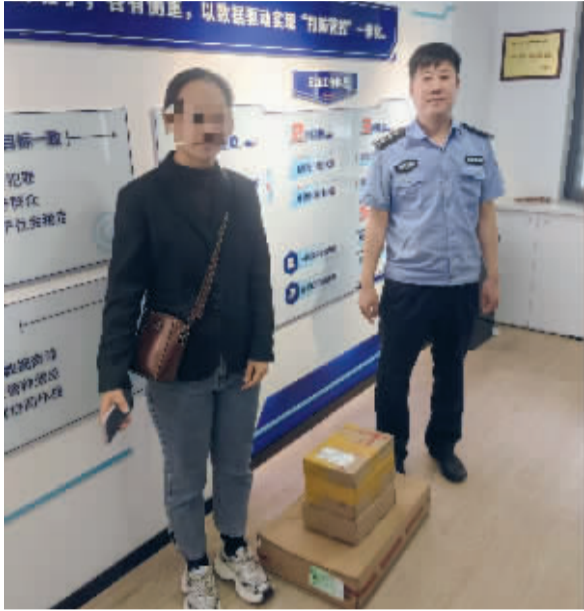
■警企联动及时帮张女士(左)拦截回其所购物品。