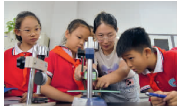
■让我看看这是什么。

本报讯(记者 孔琳 通讯员 聂银峰)9月是全国科普月,今年的主题是“科技改变生活 创新赢得未来”。为培养少先队员的科技创新兴趣、提升科学素养,近日,石家庄市栾城区凌空桥路小学20名少先队员与辅导员,在栾城区科协组织下走进河北英利体育用品有限公司,探索科技的力量。