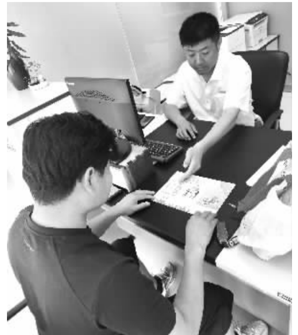
■中国银行隆尧支行客户经理在给客户讲解明示企业贷款综合融资成本政策。

明示企业贷款综合融资成本试点工作提升了银行与企业之间的信息对称程度,为构建互信、共赢的新型银企关系奠定了坚实基础。透明的融资环境既有助于银行更好地了解企业需求,提供精准服务,也使企业能够放心融