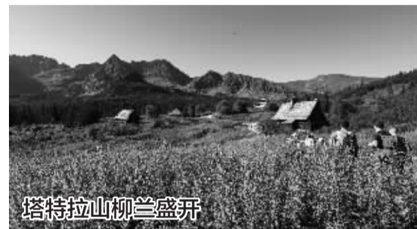
塔特拉山柳兰盛开

该商场5日晚些时候恢复正常营业。新世界百货为韩国百货巨头之一,位于繁华商圈,客流量大。