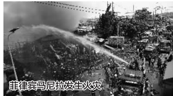
菲律宾马尼拉发生火灾

■8月6日,消防员在菲律宾马尼拉火灾现场救火。当日,马尼拉一贫民窟发生大火,至少1500户受影响,3人受伤。