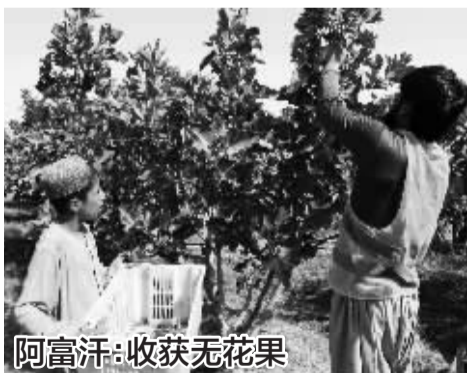
阿富汗:收获无花果