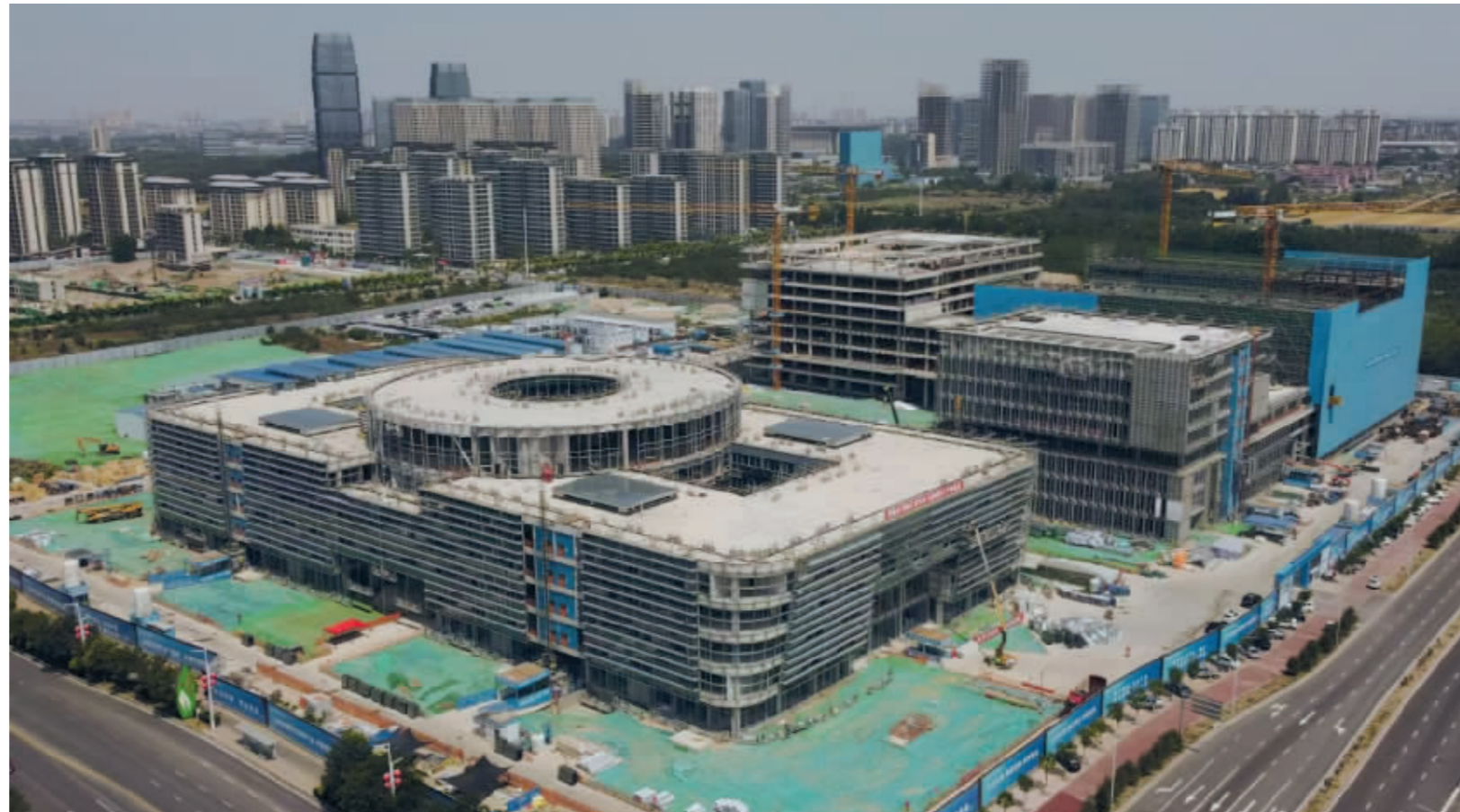
■石家庄正定未来电子信息与装备制造产业基地(一期)项目正在紧张建设中。

据悉，北站 7 道线路开通后将承担石太客货列车下行任务，X 道将承担上行任务。此次天窗点施工的顺利完成，标志着石家庄北站改造工程进入新阶段，同时也为石家庄北站改造工程的整体开通奠定了基础。