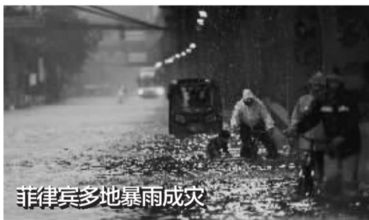
菲律宾多地暴雨成灾