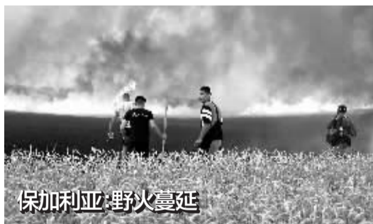
保加利亚·野火蔓延