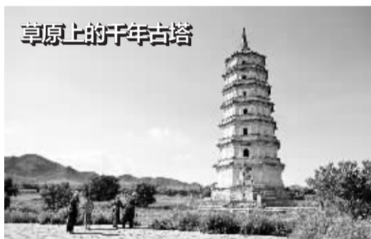
草原上的千年古塔

据美联社21日报道，坠机原因尚不清楚，美国联邦航空局和国家运输安全委员会已着手调查。