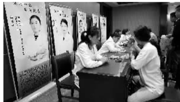
■医疗专家进企业送健康活动现场。

本报讯(记者 李惺)近日,由河北省总工会、河北省卫生健康委主办,河北省胸科医院等承办的2025“温暖一线 关爱健康”医疗专家进企业送健康活动,走进河北省木兰围场国有林场。