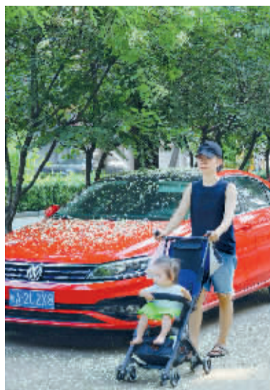
■满城尽带槐花香。