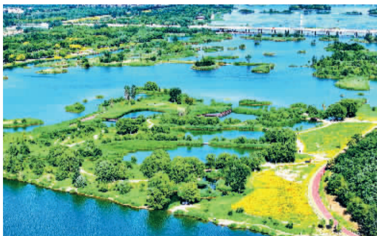
■滹沱夏日画卷。