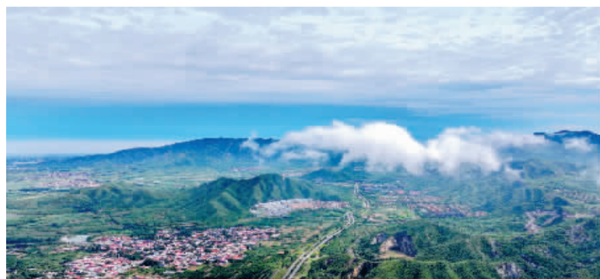
■云雾缭绕的美丽山区。