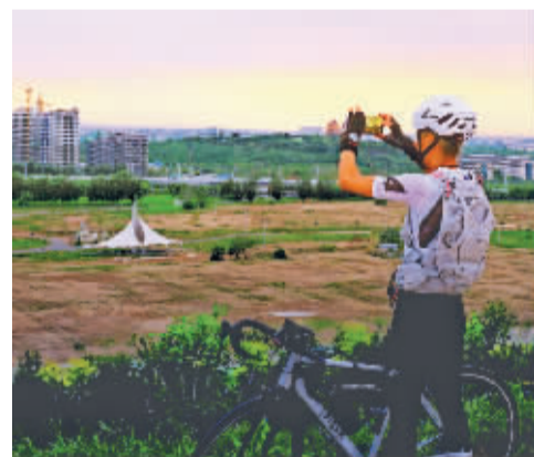
■记录一路风景。