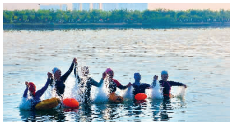
■游泳爱好者横渡滹沱河。