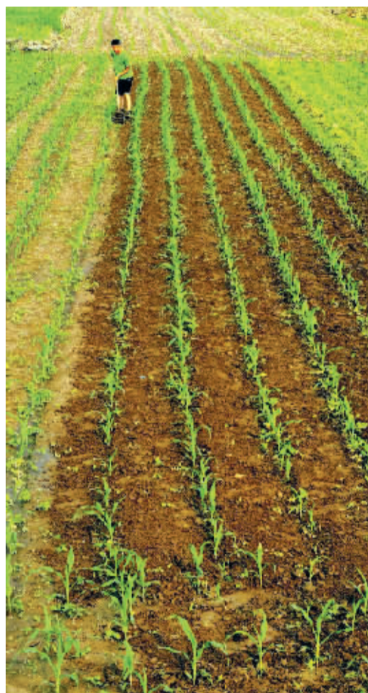
■锄禾日当午。