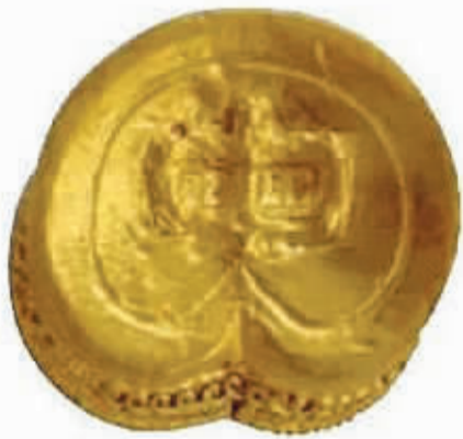
■中山怀王墓出土的铭文马蹄金。