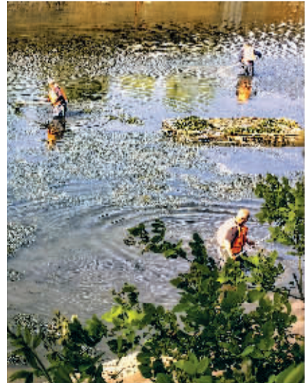
■翠屏湿地公园水域工人正在打捞水草。