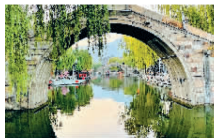
■龙泉古镇赛江南。