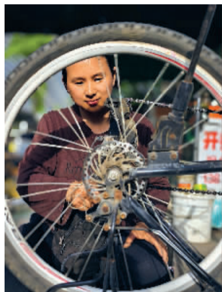
■忙碌的女修车师傅。