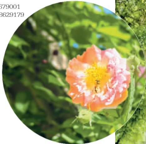
■蔷薇花引来勤劳的小蜜蜂。

4月的石家庄,不经意的街角,蔷薇开始静静绽放。它们不言不语,却以缱绻的藤蔓、烂漫的繁花,将寻常巷陌点缀成最动人的花街。粉的、紫的、白的,千朵万朵的小花簇拥着攀在栅栏或围墙上,倾泻如瀑,在城市的坚硬轮廓里晕染出柔软的诗意。