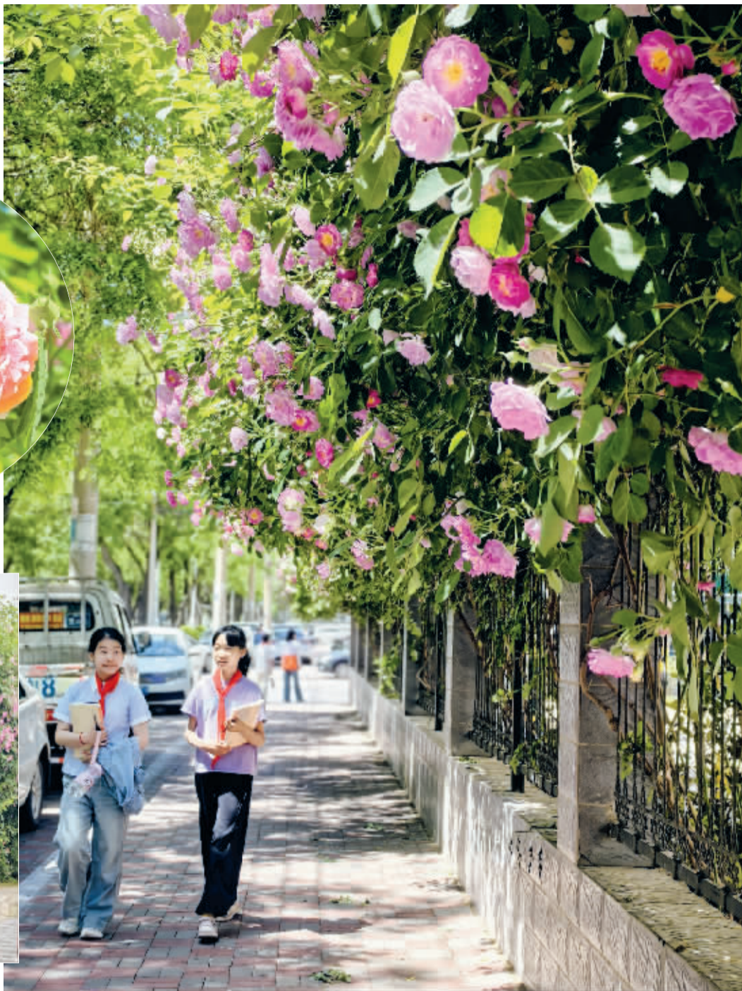
■放学的孩子们走过东苑小学的蔷薇花墙。