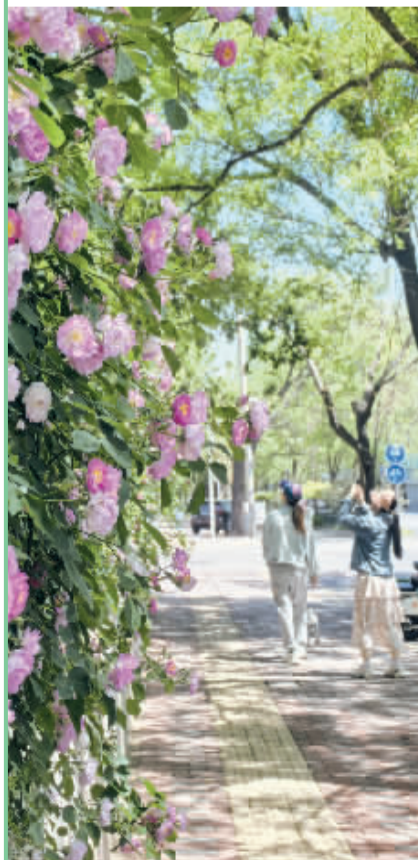
■体育大街和槐安路交叉口的蔷薇花墙。

作为“治愈系”花卉的代表,蔷薇正以其独特魅力装点着石家庄的街头巷尾。与多数春季花卉不同,蔷薇的花期可以从晚春延续至仲夏,为城市带来持久而浪漫的视觉享受。此时,走在石家庄街头,一个转身、一次回眸,你都有可能与蔷薇邂逅。据石家庄市园林局相关负责人介绍,蔷薇是世界著名的观赏植物之一,是一种蔓藤爬篱笆的小花,适合围栏绿化,在石家庄一些街道庭院内,都种植了蔷薇,形成一片片美丽的花墙,而这些街道也就成为美丽的花街。如在平安大街、槐中路、北二环、友谊大街(和平路东南角);槐安路(河北美术馆周边);学府路(经贸大学沿线);信工路(燕山大街至兴安大街);栾城区新开大街(宏达路至宏远路)等街道沿线,都能看到一片片盛开的蔷薇花墙,千朵万朵的小花攀援在栅栏或围墙上,缠缠绵绵,如霞似锦,正所谓“蔷薇花满架,不语也倾城。”