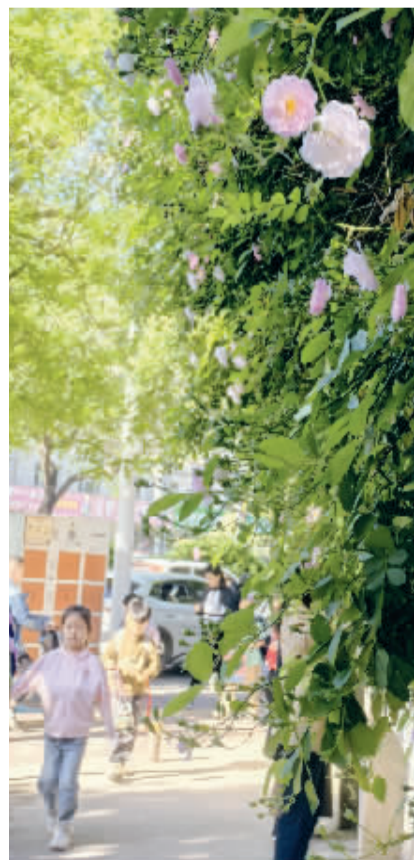
■谈固小学瑞府校区临街的蔷薇花墙。