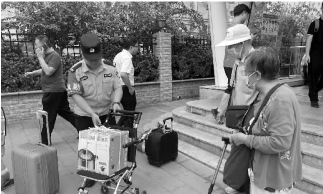
■辅警帮老人拿行李。