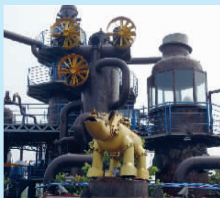
■旧工业设备改造景观。