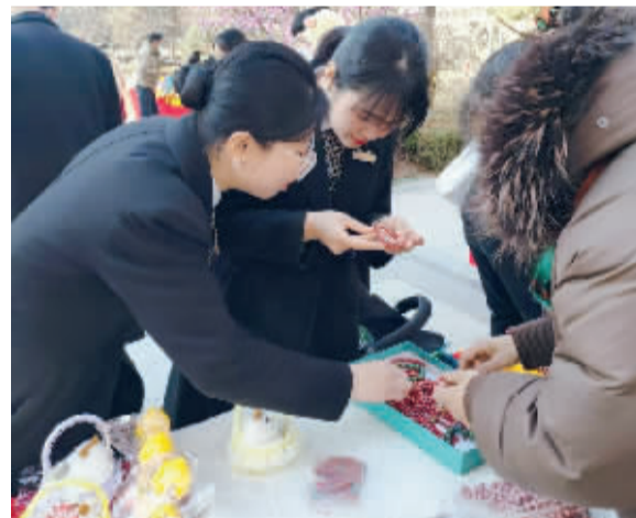
■居民在社区年货节上选购喜爱的物品。

本报讯(记者 方小北)春节将至,年味渐浓,为弘扬春节传统文化,满足辖区居民多元化、品质化、个性化的年货采购需求,着力营造欢乐祥和的节日氛围,石家庄市长安区胜北街道国赫天著社区近日举办“欢聚幸福市集,共享邻里温情”新春年货节。