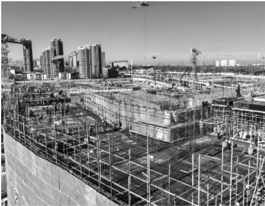
■太平河片区加速建设中。