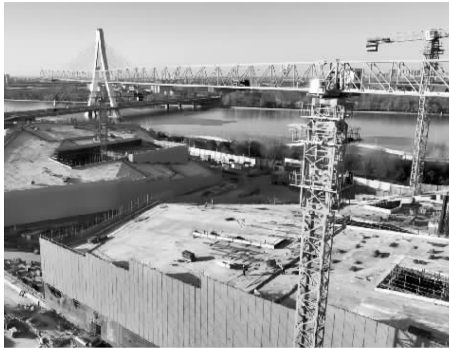
■美术馆实现封顶。