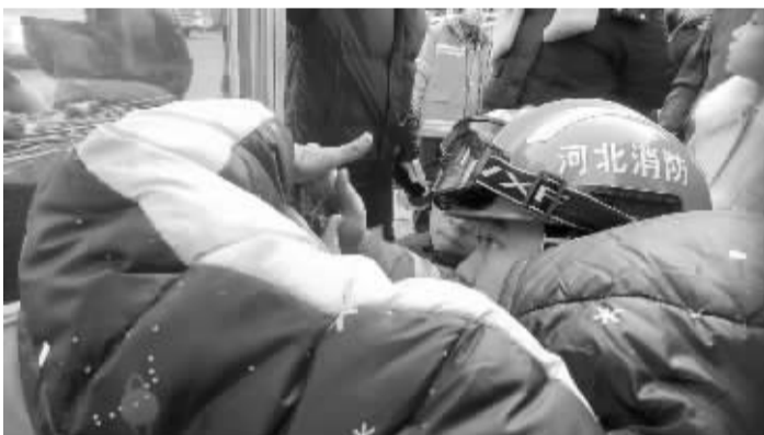
■消防救援人员小心破拆门闩孔。

1月1日16时4分,石家庄市消防救援支队建华东路消防救援站接到报警称,裕华区某小区门口,一名小孩的手指被卡,急需救援。消防救援人员接到报警后迅速出动赶赴现场。到达现场后,消防救援人员发现,一名六七岁的男孩左手无名指不慎卡在了一个卖糖葫芦摊位的门闩内。见状,消防救援人员一边耐心安抚男孩的情绪,一边迅速根据现场情况制定救援方案。凭借着专业的技能和丰富的救援经验,消防救援人员小心翼翼地操作着救援工具,在确保男孩手指不会受到二次伤害的前提下,他们对