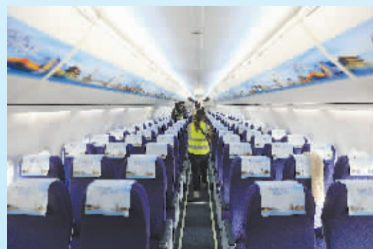
■客舱里贴有石家庄名胜古迹宣传画。