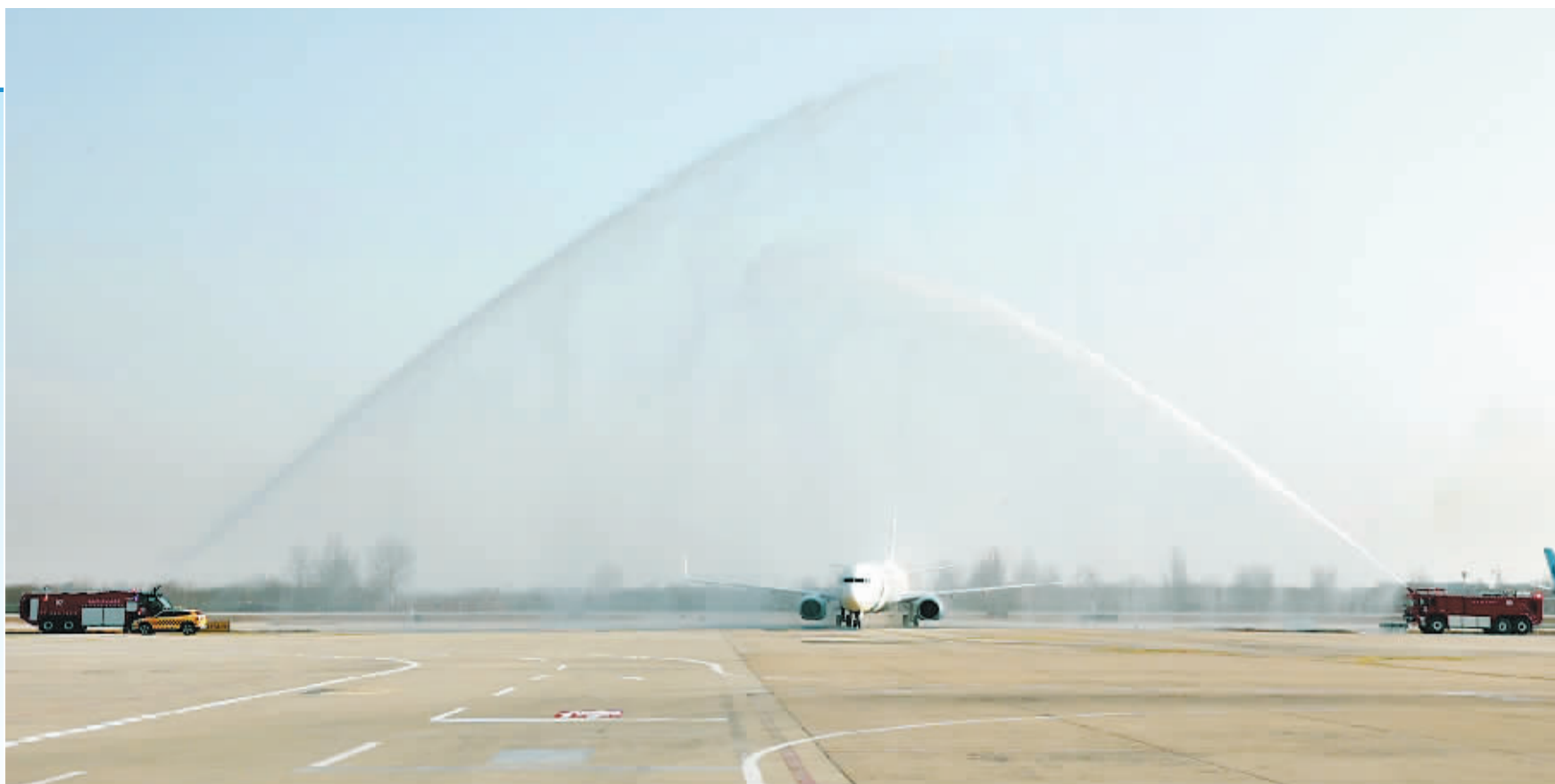
■石家庄机场以民航界最高礼遇“水门”迎接“正定号”全彩绘飞机圆满完成首航。