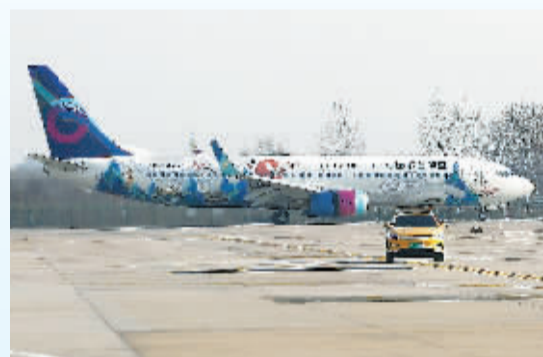
■“正定号”全彩绘飞机外观。