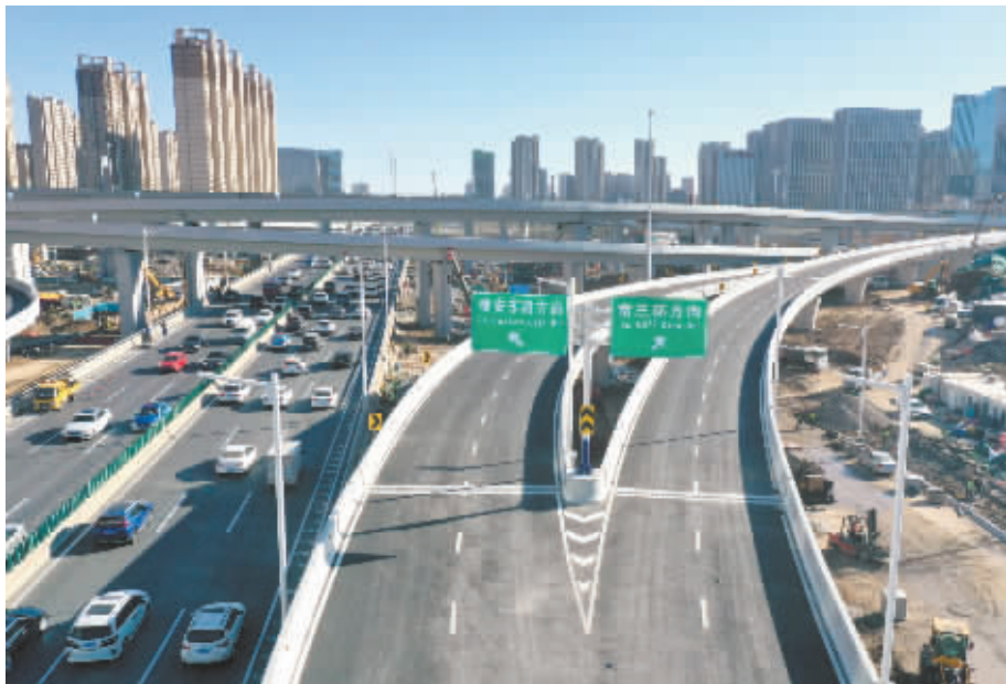
■裕翔街与南二环互通立交桥实现十二个方向的来往车辆各行其道,互不干扰。